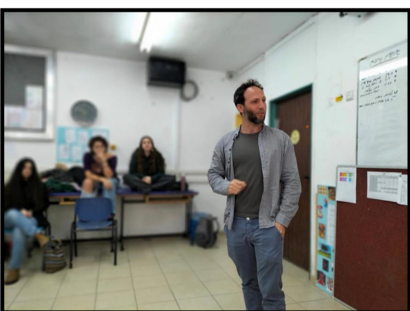
הקרנת הסרט ושיחה עם הבמאי