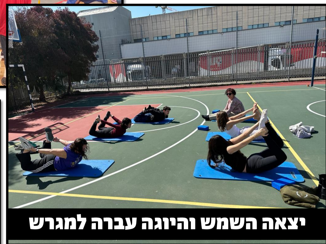
יצאה השמש והיוגה עברה למגרש