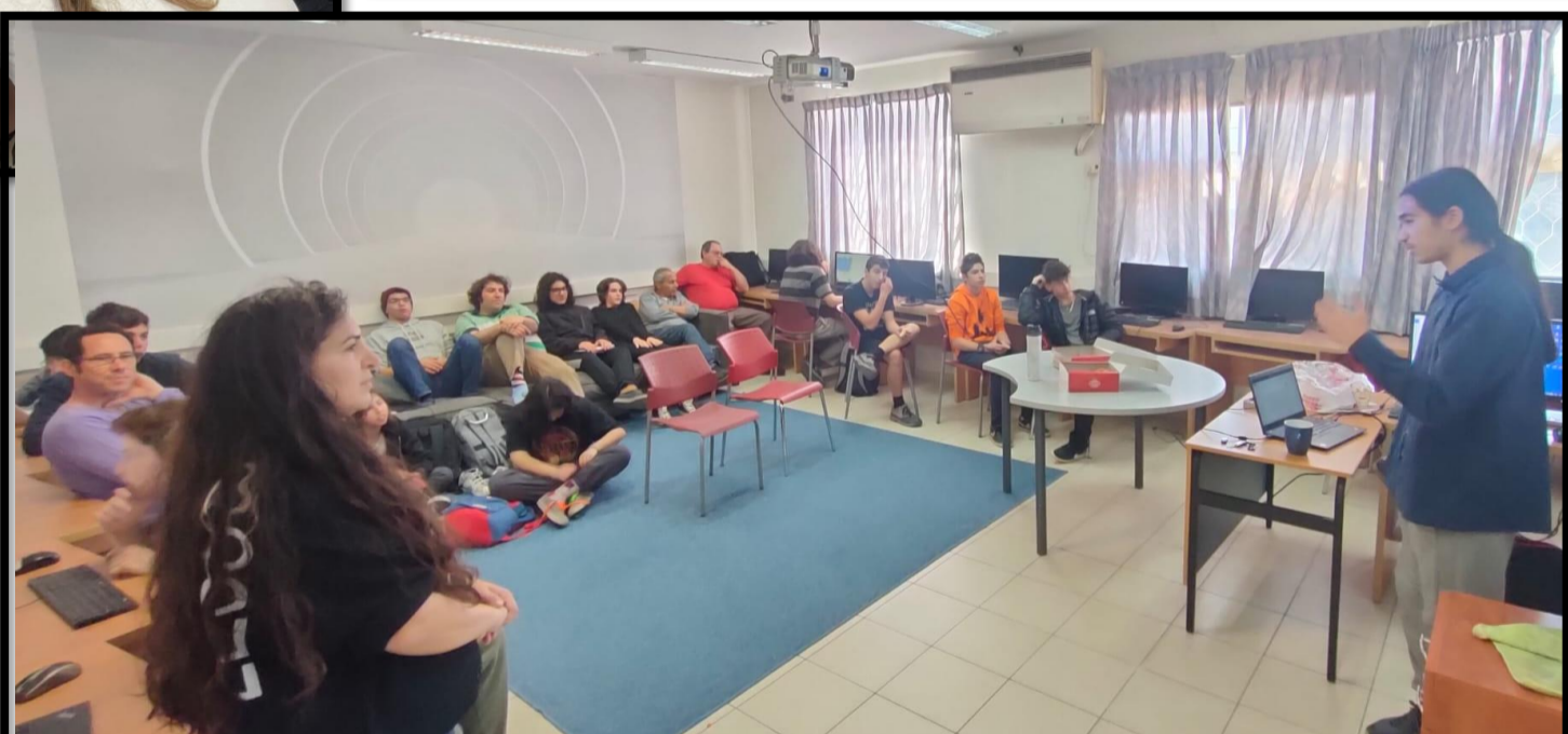
טיו בהרצאה מצויינת למגמת הייטק על לינוקס