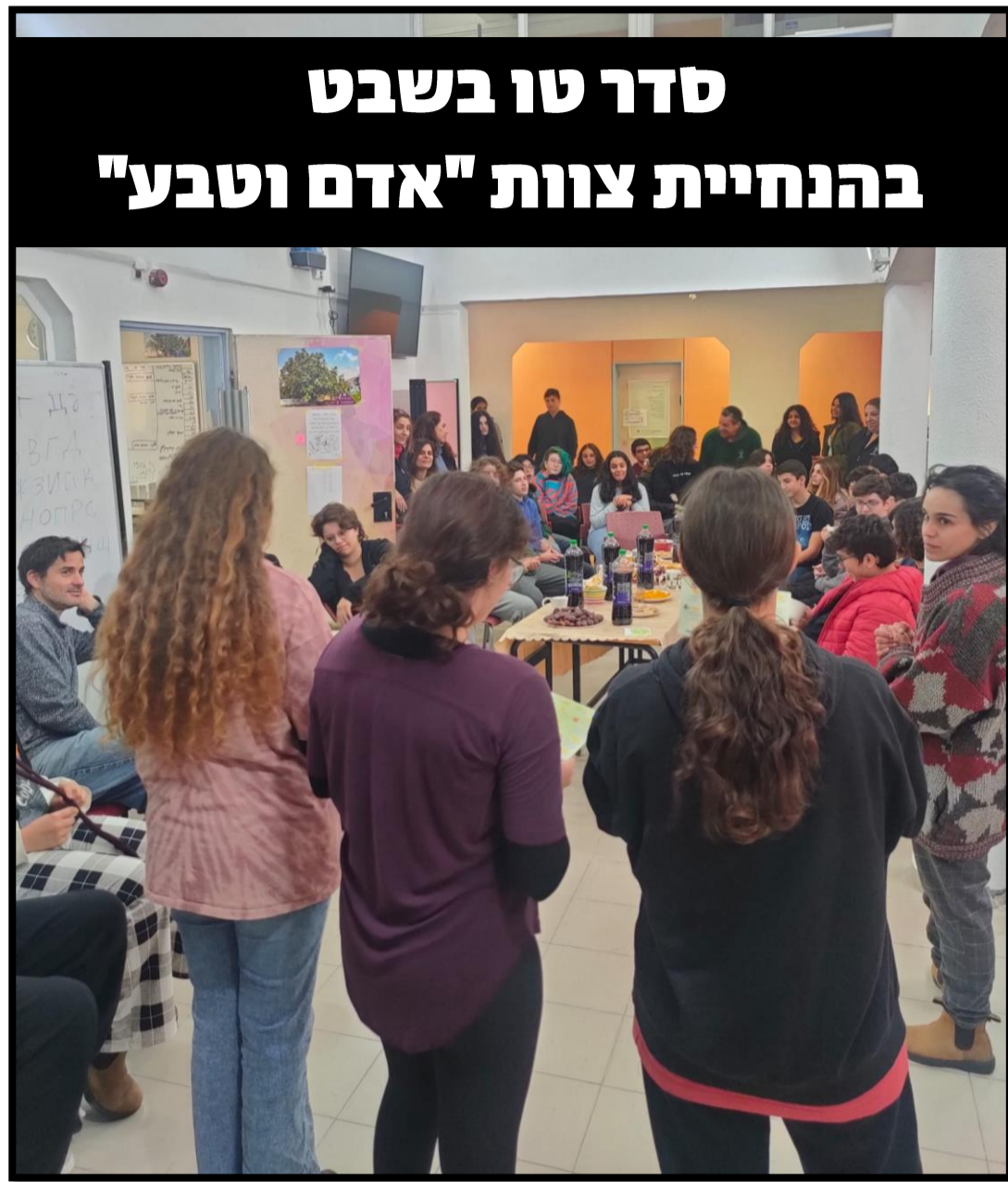
סדר טו בשבט בהנחיית צוות "אדם וטבע"

חודשי החורף נותנים לנו הזדמנות להתקדם ולהעמיק בלמידה. אנו רואים העמקה גם בקבוצות הלימוד, גם ביוזמות של חניכות וחניכים וגם ביכולת של הצוות לדייק את כלל הפרקטיקות שלנו יחד עם תכנון מעמיק של מה שיקרה בשנה הבאה. אנו נמצאים בימים אחרונים של ראיונות וקליטה לשנה הבאה. מזמנותים 😊