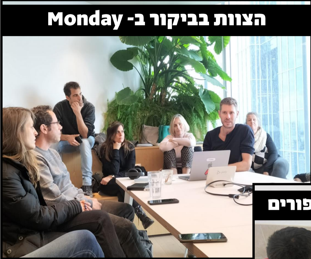
הצוות בביקור ב-Monday