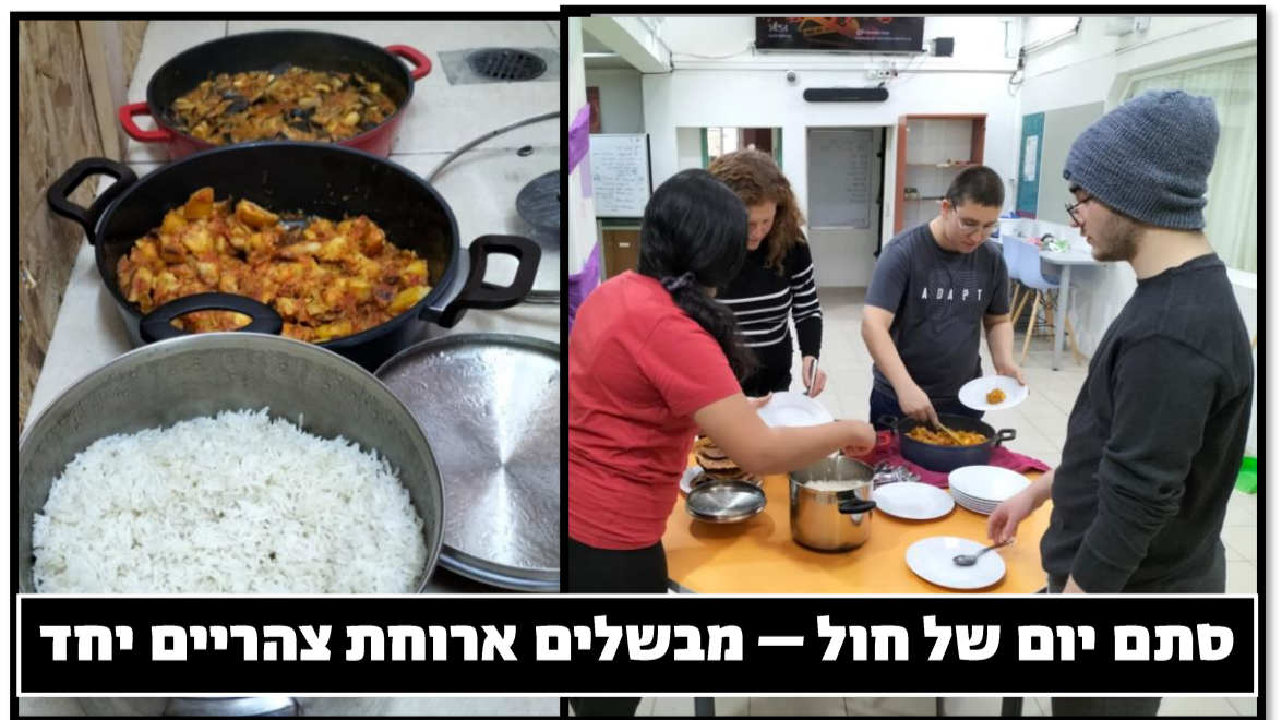
סתם יום של חול – מבשלים ארוחת צהריים יחד