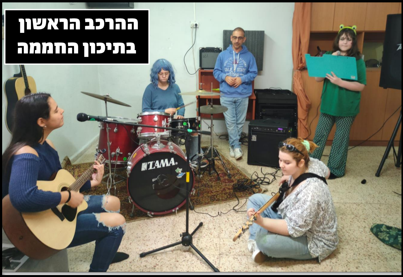
הרכב הראשון בתיכון החממה

מרץ בתיכון החממה בחמישי האחרון, המנטור אלחנן ציטט באוזני את אביו, הרב צוהר. נסכם את דבריו במילה אחת: "סבלנות". כמה שהוא צדק! תיכון החממה מעמיד בפני חניכים וחניכות משימה קשה - תחליטו במה תרצו להתפתח, תמצאו את הדרך המיטבית עבורכם ללמוד ותצרו מהלמידה תוצר שמוסיף טוב לעולם! וזה קשה! לחלק יותר, לחלק פחות. לחלק קטן זה לוקח כמעט חצי שנה להגיע למקום הזה. כמה זה מרגש לראות אותם לאחר חודשים של עבודה, מגיעים למקום בטוח, שמח ואיתן.