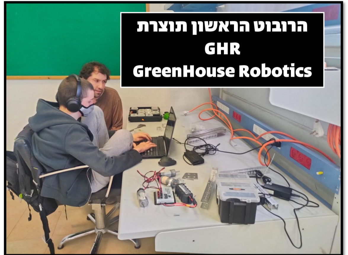
הרובוט הראשון תוצרת GHR GreenHouse Robotics