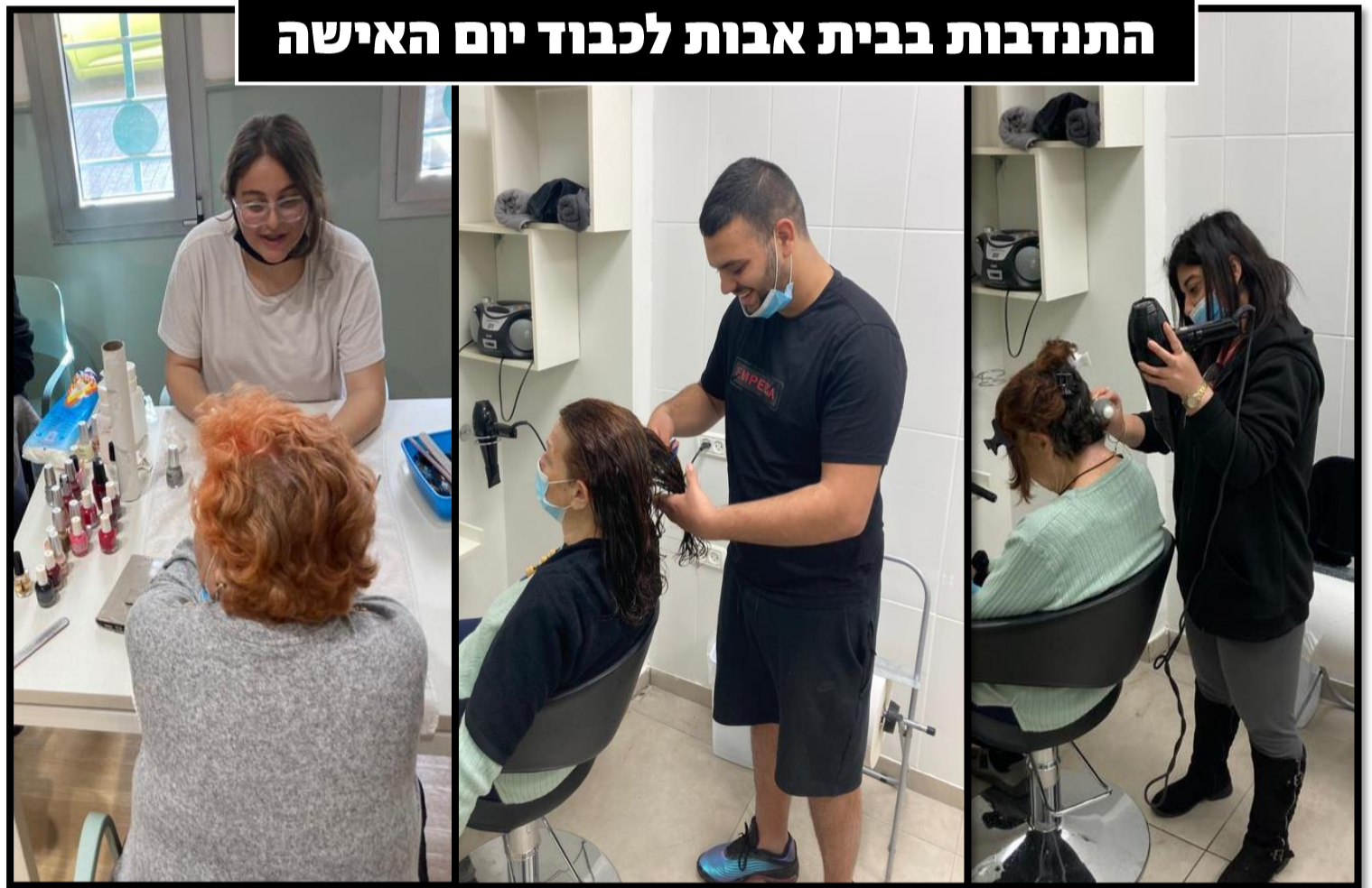
התנדבות בבית אבות לכבוד יום האישה