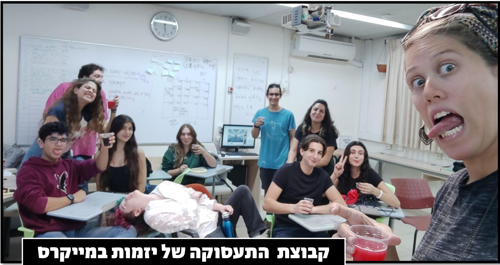
קבוצת התעסוקה של יזמות במייקס חוגגת השלמת תהליך ייצור ראשון