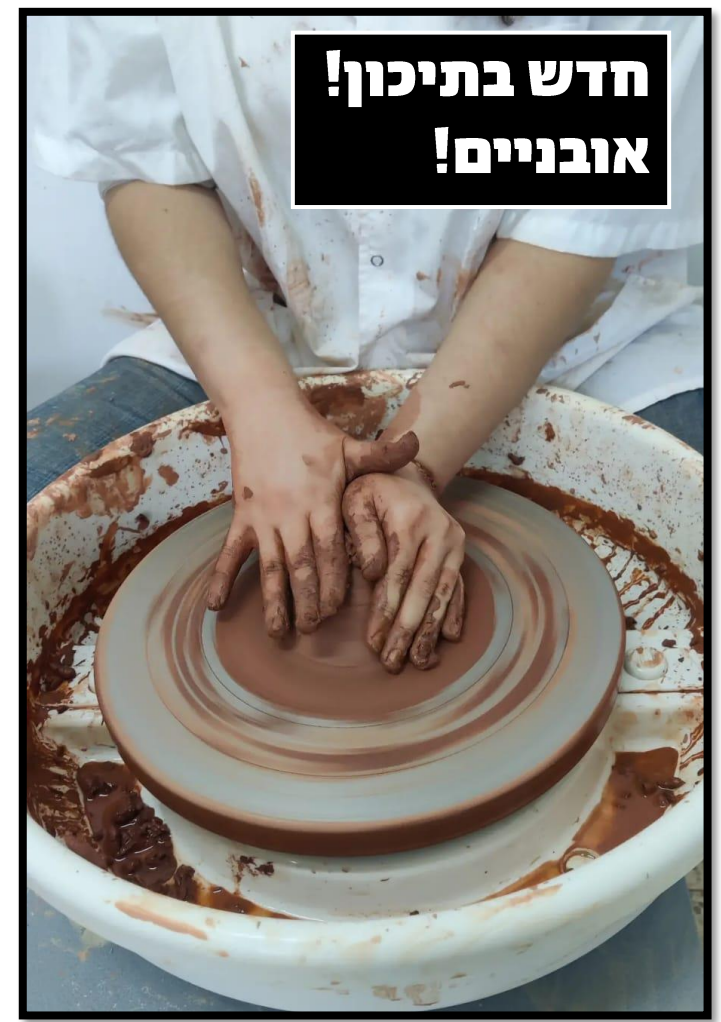
חדש בתיכון! אובניים!

"ונכתתו חרבותם לאתים וקנייתותיהם למזמרות, לא ישא גוי אל גוי חרב ולא ילמדו עוד מלחמה." (ישעיהו, פ"ב, ד')