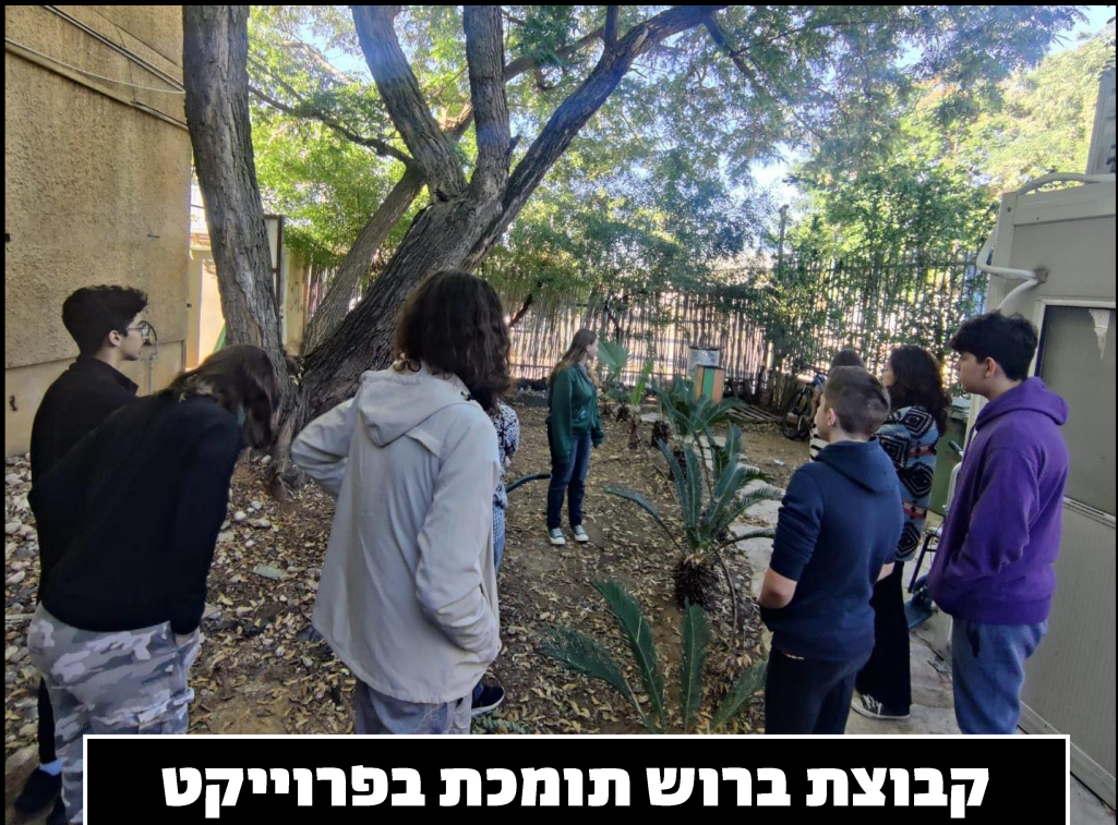
קבוצת ברוש תומכת בפרוייקט אדריכלות נוף ונגרות של שקד