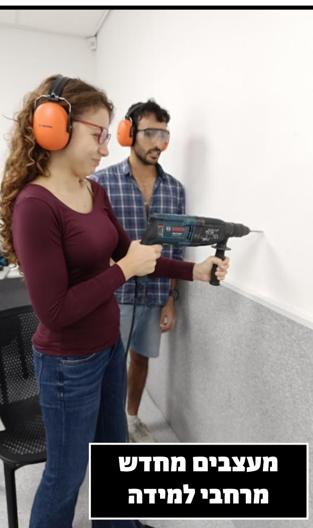
מעצבים מחדש מרחבי למידה