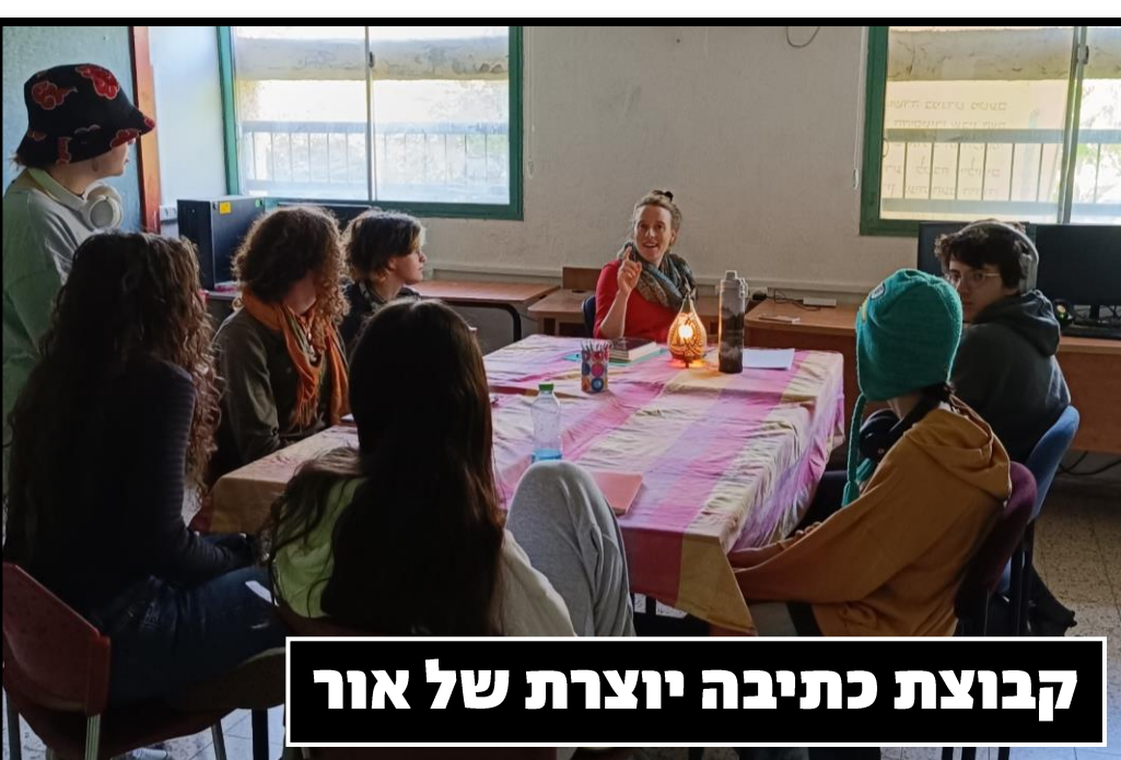
קבוצת כתיבה יוצרת של אור