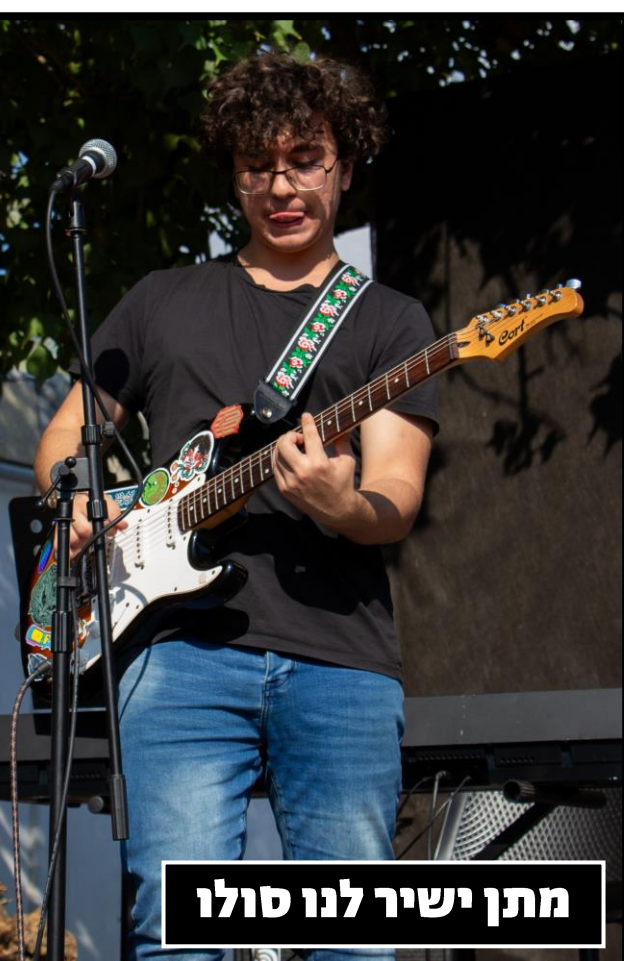
מתן ישיר לנו סולו