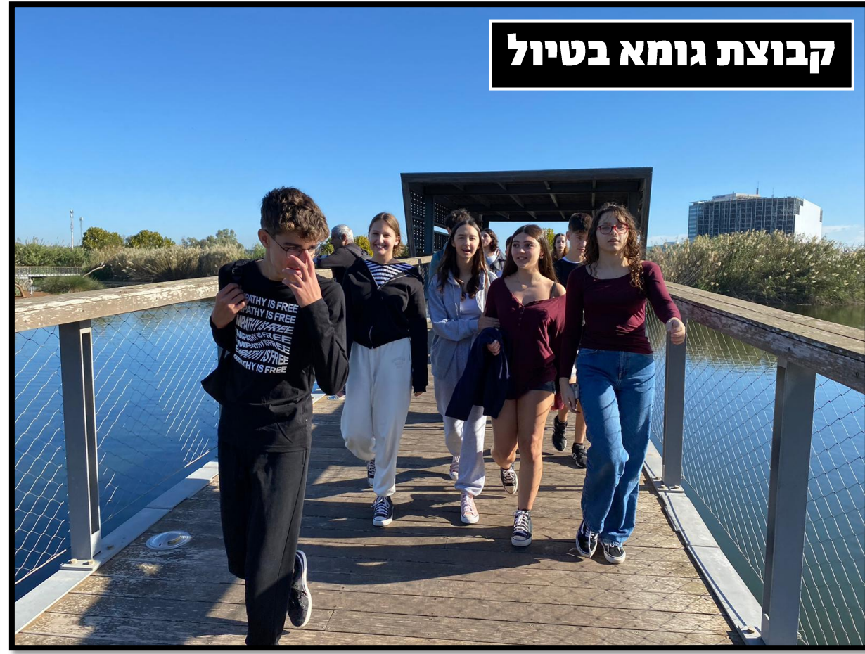
קבוצת גומא בטיול