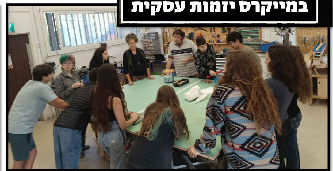
תערוכה ופרזנטציות הצגת פרויקטים ראשונים תקופה א'