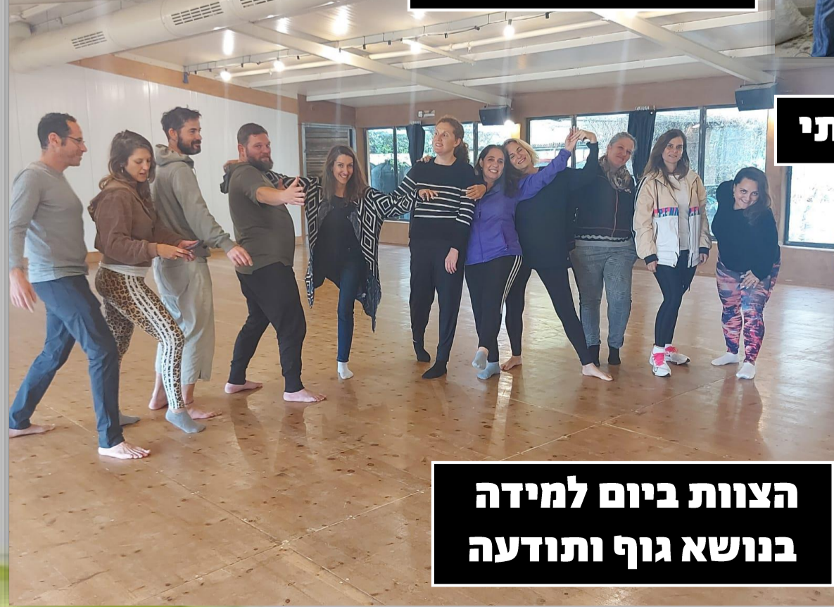
הצוות ביום למידה בנושא גוף ותודעה