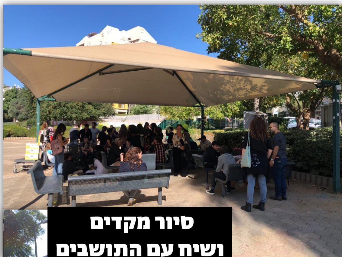
סיור מקדים ושיח עם התושבים